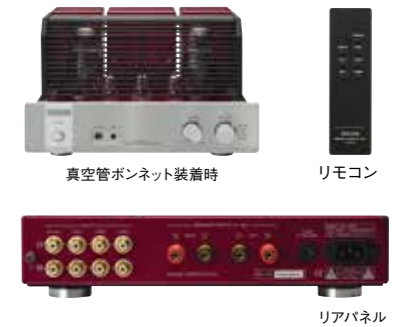
真空管ボンネット装着時

高出力が得られるKT150真空管を片チャンネルに1本ずつ搭載したA級シングル回路で、様々なスピーカーをしっかりドライブする出力18W+18W(8Ω)を実現しています。電源部は大型トロイダル電源トランスとレスポンスが早く損失が少ないSiCショットキーバリアダイオードの整流回路を組み合わせ、安定かつ強力な電源供給を可能としています。シャーシ面にはバイアスマーターとバイアス調整ボリュームを装備しており、メーターを確認しながら簡単にバイアス調整ができます。付属リモコンはアルミ削り出しの重量感あるリモコンで、音量調整、ミュート、入力切替の操作が可能です。入力はLINE入力3系統の他にフォノイコライザーを搭載したPHONO入力 (MM型対応) も備えており、アナログレコードプレーヤーも接続できます。