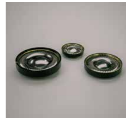
CZ-8Aのドライバーユニット

片側にメインドライバー 2個と逆チャンネル再生用ドライバー 1個の計3個のドライバーユニットを搭載しています。メインドライバー (高音用23mm/低音用40mm (CZ-1、CZ-8A)、35mm (CZ-10、CZ-12)) はベリリウムコーティング振動板を採用。CZ-1の低音用ドライバーには真鍮フレームを、CZ-8A、CZ-10、CZ-12では真鍮リングを採用。低音から高音までダイナミックで自然な音の再生を実現しました。