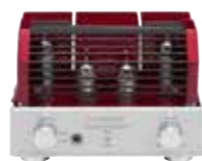
真空管ボンネット装着時

赤いRubyとは対照的な、美しいパールホワイト塗装とブルーLEDの真空管照明によるクールでスタイリッシュなデザインです。横幅19cm、奥行き18cmのコンパクトなサイズは、デスクトップやベッドサイドなどをおしゃれな音楽空間に演出します。音は心地良く美しい真空管サウンド。小型ながら駆動力があり、バランスが良い6BQ5真空管を搭載しています。出力回路は、6BQ5真空管の持ち味をそのまま引き出す純A級シングル回路を採用。また、ヘッドホン端子も装備し、真空管が奏でる美しいサウンドをヘッドホンでも楽しめます。