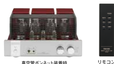
真空管ボンネット装着時

真空管アンプの素晴らしい音をより多くの人に楽しんでいただきたいという企業理念のもとシンプルでお求めやすい価格を実現したモデルです。バランスが良く音楽性に優れた出力管EL34の魅力を残すところ無く引き出すAB級プッシュアップの回路構成で、出力は18W+18W (8Ω) を確保。真空管交換時のバイアス調整の必要がない自己バイアス方式を採用しています。4系統のLINE入力を備えており様々なソース機器を接続できます。横幅は標準的なコンポサイズよりコンパクトな345mmで、設置スペースのバリエーションが広がります。フロントパネルにはヘッドホン端子を装備。夜間などスピーカーから音が出せない時でもヘッドホンで真空管の極上サウンドが楽しめます。