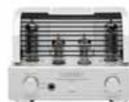
真空管ボンネット装着時