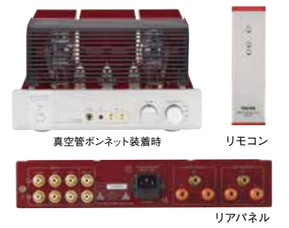
真空管ボンネット装着時

TRV-A300XRは、300Bの魅力を引き出すA級シングルアンプです。固定バイアス方式ですが、天面にバイアス確認用のメーター、バイアス調整ボリューム、ハムバランスボリュームを設けてありますので、真空管交換時にも簡単に最適な調整ができます。本機では整流回路にSiCショットキーバリア整流ダイオードを採用し、トロイダル電源トランスと相まって効率が良くレスポンスに優れた電源回路を構成しています。フォノイコライザー回路 (MM型対応)、音量調整用のリモコンも標準装備しています。トライオードのスタンダードとなる一台に仕上げました。往年の300Bオリジナル真空管に迫るクオリティを再現した真空管PSVANE WE 300Bを搭載したPSVANE WE 300B仕様もラインアップしています。