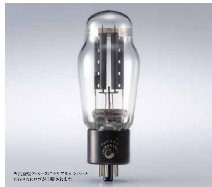
※真空管のベースにシリアルナンバーとPSVANE ロゴが印刷されます。

2012年ついにそのベールを脱いだPSVANE WE300Bは多くの方々の高評価を得ております。出来ればその他の著名真空管も復活して欲しいとの声を受けてWE300Bとコンビを組むPSVANE WE274Bが登場しました。その作りはWE300Bに匹敵するほど美しくその容姿に目を奪われるほどです。