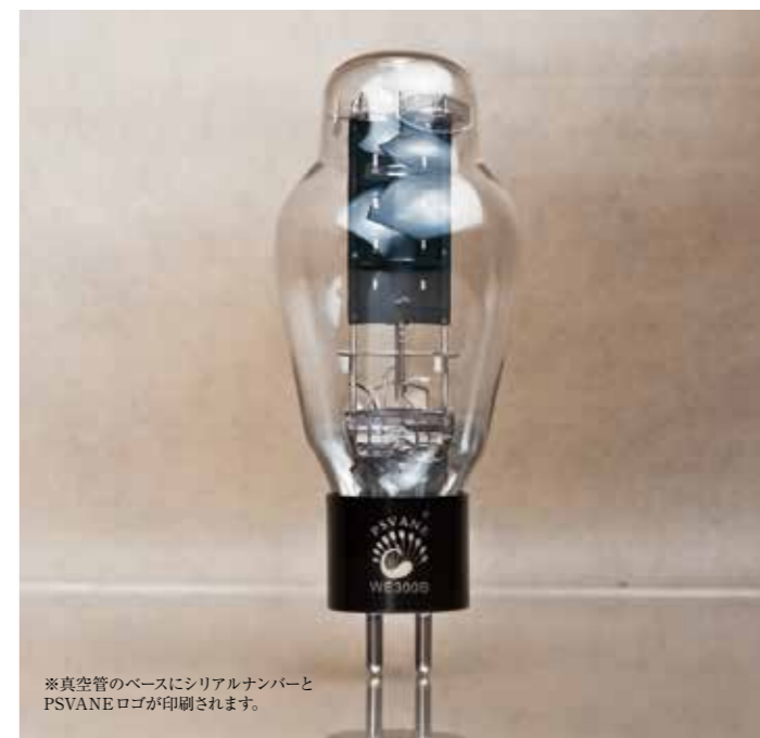
※真空管のベースにシリアルナンバーとPSVANE ロゴが印刷されます。

※期間限定: 300B搭載トライオード製品所有の方、PSVANE WE300Bを購入されるとバイアスおよびハムバランスの無料調整サービスをいたします。是非この機会にお求めください。(往復送料は別途)