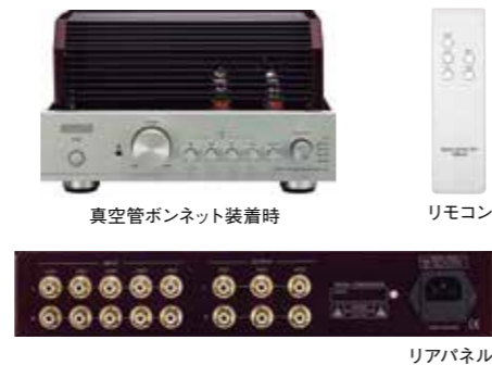
真空管ボンネット装着時

好評だった真空管プリアンプ「TRX-1」の後継で、便利で使いやすい機能はそのままに、電源部の整流回路を整流管から効率が良く応答特性に優れたSiCショットキーバリアダイオードに変更し、電源部の強化と信頼性向上を図ったモデルです。4バンドイコライザーは、調整可能周波数150Hz、400Hz、2kHz、10kHz(±10dB)で、部屋の音響特性の補正や、夜間など小音量時に不足しがちな低域特性の調整、さらにお好みのバランスへの調整も可能です。重量感があるアルミ削り出しの高級リモコンを付属し音量、ミュート、入力切替、イコライザー ON/OFFの操作が可能です。3系統の出力を備えており、バイアンプ駆動などにも対応できます。