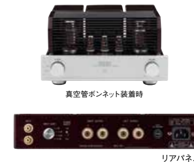
真空管ボンネット装着時

TRX-P88Sはトライオード初のKT88のA級シングルドライブステレオパワーアンプです。KT88をシングルドライブで使用しており、KT88の太く力強い音の持ち味をありのままにお楽しみいただけます。固定バイアス方式ですが、天面にバイアス確認用のメーター、バイアス調整ボリュームを備えており、真空管交換時に簡単にバイアス調整ができます。プリアンプTRX-1、TRX-3と組み合わせれば、外観デザインもマッチします。また、本機はパワーアンプですが背面のスイッチで音量ボリューム付きアンプに切り替えが可能です。入力は1系統のみですが、シンプルなプリメインアンプとしても使用できます。