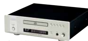
ブラック仕様もあります。