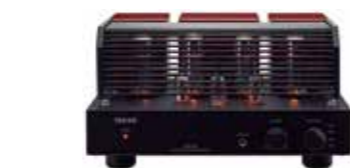
真空管ボンネット装着時