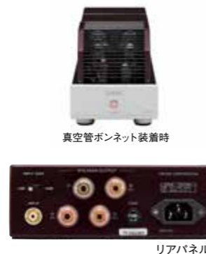
真空管ボンネット装着時

多くのオーディオファンに愛され、トライオードの社名のもとになった直熱三極管300Bの音の魅力を最大限に味わっていただけるパワーアンプです。モノラルとすることにより、理想的なチャンネルセパレーションを確保し、チャンネル間の相互干渉を排除し、素晴らしいステレオイメージが広がります。回路は基本的な純A級バラシングルで300B特有の艶やかで美しい響きを奏でながら、15Wのドライブ能力も確保しています。バイアス回路はメンテナンスフリーの自己バイアス回路とし、300B真空管交換時にはハムバランス調整がシャーシ上面から簡単に行えます。往年の300Bオリジナル真空管に迫るクオリティーを再現した真空管PSVANE WE300Bを搭載したPSVANE WE300B仕様もラインアップしています。