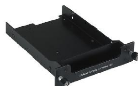
Storage Drive Bay